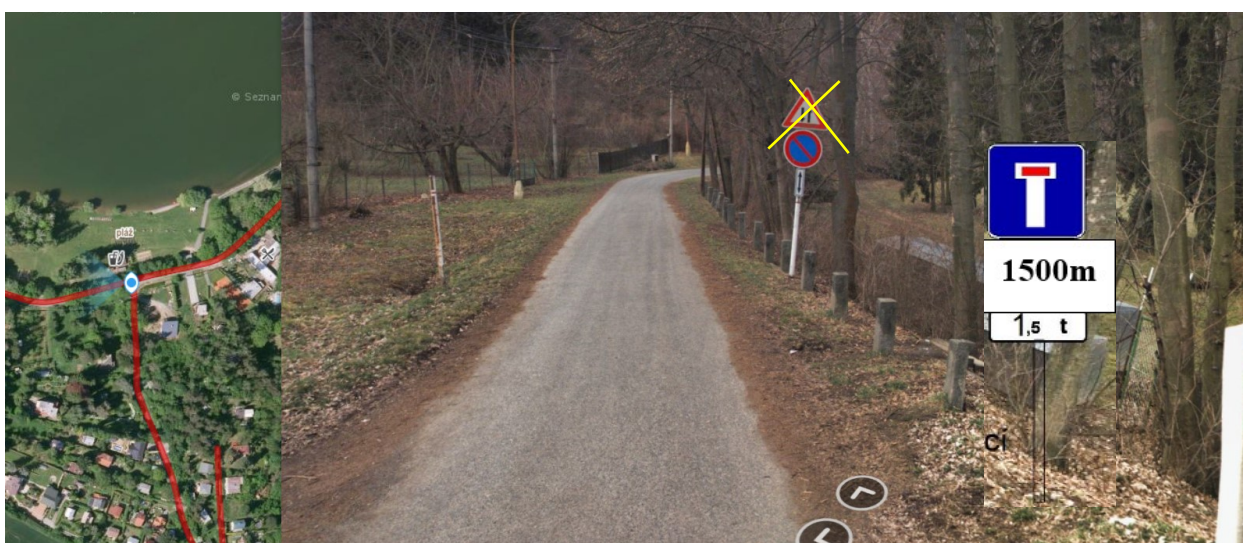
Foto č. 10 - Dopravní značka A9 „Obousměrný provoz“ je nadbytečná dopravní značka a je možné ji odstranit. Dále budou doplněny značky IP4a (slepá komunikace) + E3a (vzdálenost) 1500m + E5 (největší povolená hmotnost) 1,5t