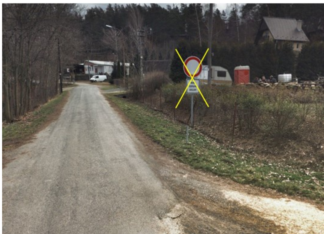
Foto č. 1 – Dopravní značení B1 „Zákaz vjezdu“ + dodatková tabulka E13 „Text“ bude odstraněna.