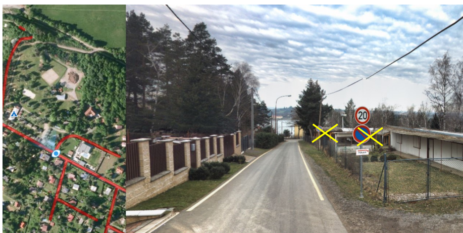
Foto č. 3 – u kempu nad přehradou v Mostkovicích budou odstraněny svislé dopravní značky 2x B29 „Zákaz stání“ a ponechá se pouze vodorovná dopravní značka V12c „Zákaz zastavení“.