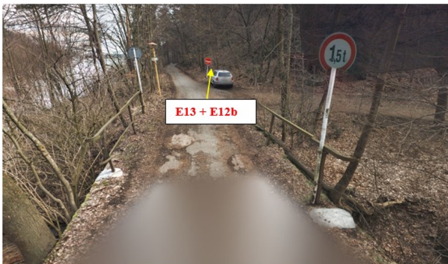
Foto č. 4 – Doplnit dopravní značení o dodatkovou tabulku E13 (Cyklistům vjezd povolen) + E12b „Vjezd cyklistů v protisměru povolen“