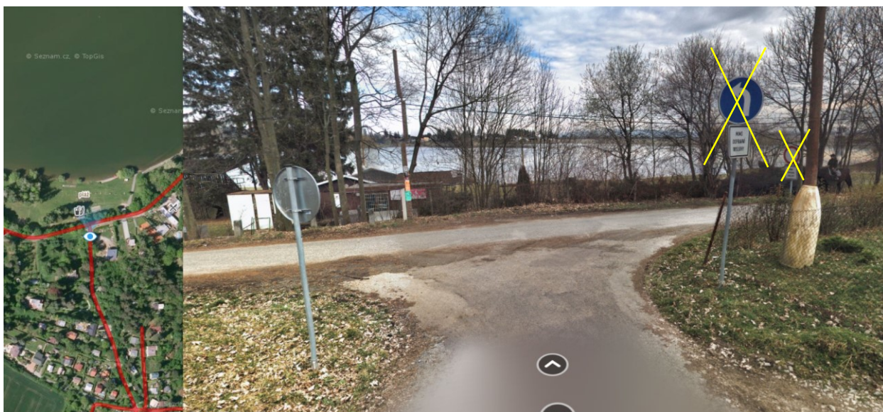
Foto č. 9 - odstranění DZ B1 (zákaz vjezdu) + E13 (text), C2b (příkázaný směr odbočování vlevo + E13 (text)