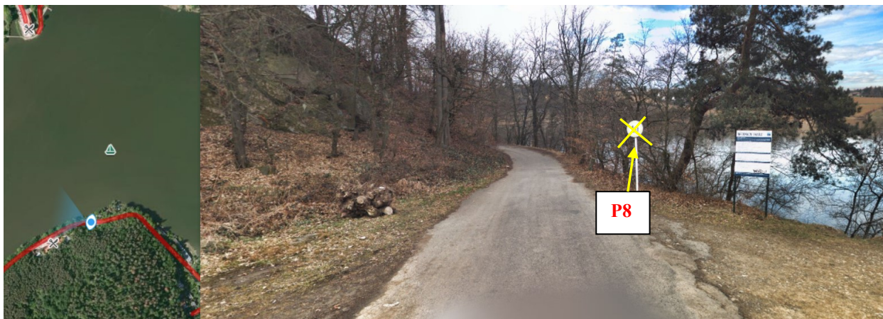
Foto č. 8 - U vyhlídky vyměnit DZ B13 za P8 (přednost před protijedoucími vozidly)