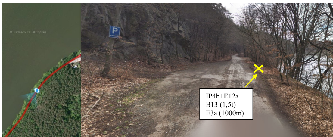
Foto č. 6 – u lomu ve směru od Zlechova do Plumlova – nově umístit pod sebe IP4b (jednosměrka) + E12a (jízda cyklistů v protisměru), B13 (s vyznačením 1,5t) a E3a (1000m)