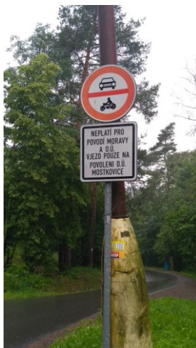
Foto č. 2 – Ve stoupání (klesání) od břehu přehrady ke kempu se nachází značka B11 „Zákaz vjezdu všech motorových vozidel“ s dodatkovou tabulkou E13. Zde bude upraven text z obou směrů jízdy. Nově bude text znít „Mimo Povodí Moravy, s.p. a dopravní obsluhu“.