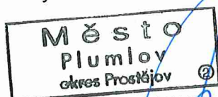
Gabriela Jančíková starostka Města Plumlov